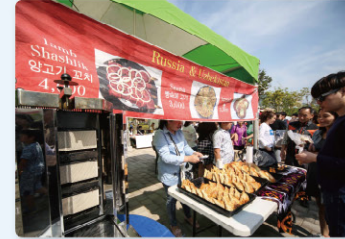
세계 품물 · 음식전 World Arts-Crafts & Foods