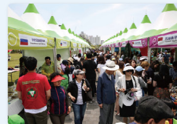
글로벌 홍보관 & 마켓 Global Information Booths and Flea Market