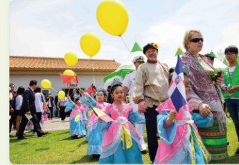
오프닝 퍼레이드 Opening Parade