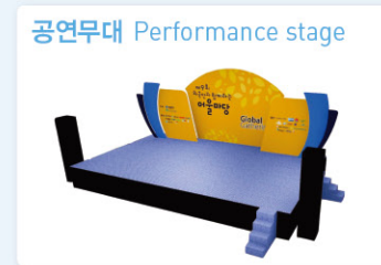
공연무대 Performance stage 무대 사이즈 15m x 8m (예정), 음향시설 Stage size 15m x 8m (Tentative) Sound equipment