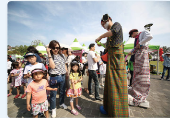
체험이벤트 Experience and Entertainment Zones