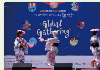
해외 자매도시 · 국내 초청 공연 Overseas Sister Cities and Domestic Performances