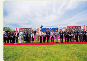
개막식 Opening Ceremony