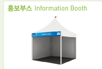
홍보부스 Information Booth 부스사이즈 3m x 3m Booth size 3m x 3m